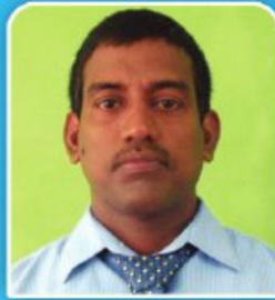
Mr. V. Piraphakaran